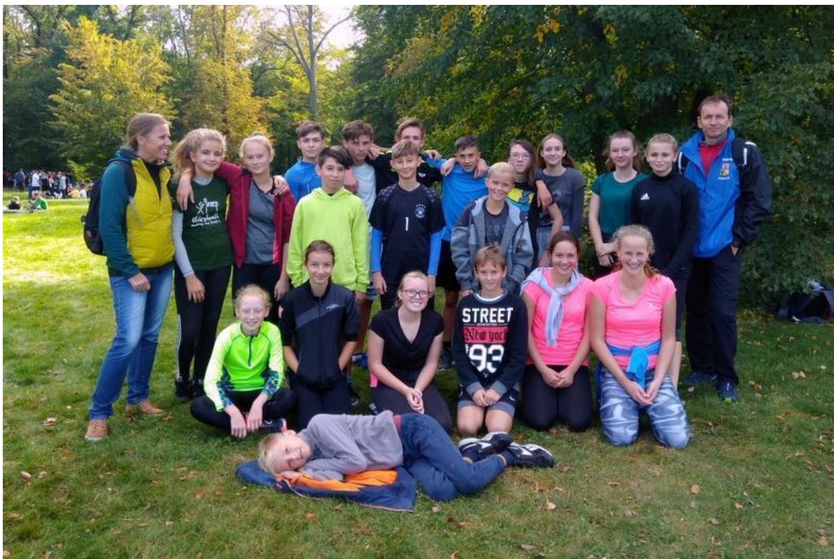
Okr. kolo v přespolním běhu - září 2019