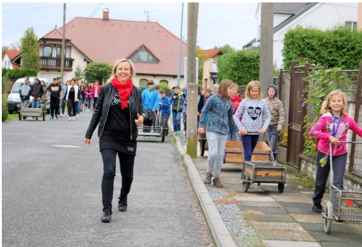
Sběr papíru - září 2019