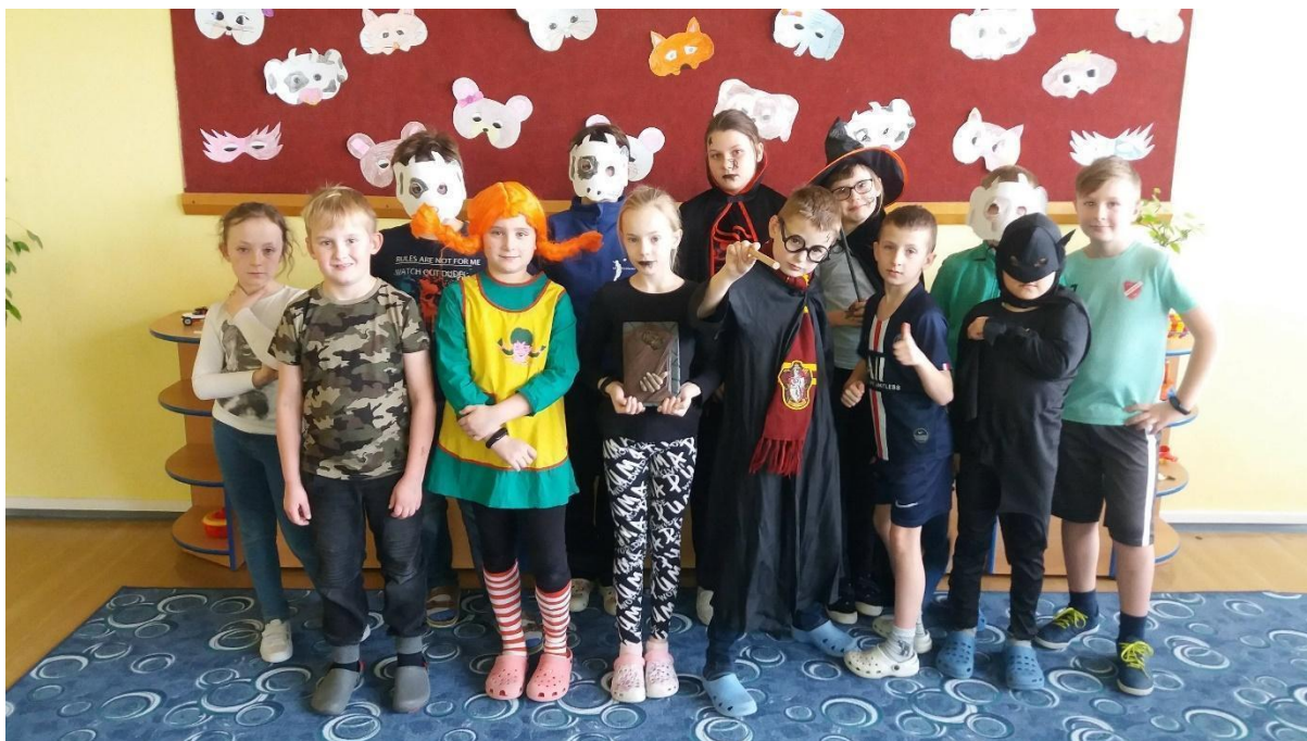
Masopustní karneval ŠD - únor 2020