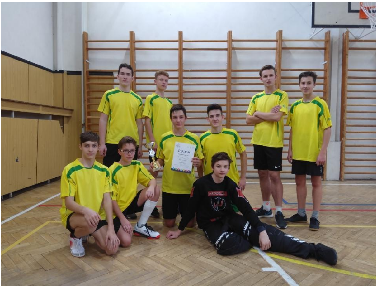
Florbal Nymburk - 8.-9.r., listopad 2019