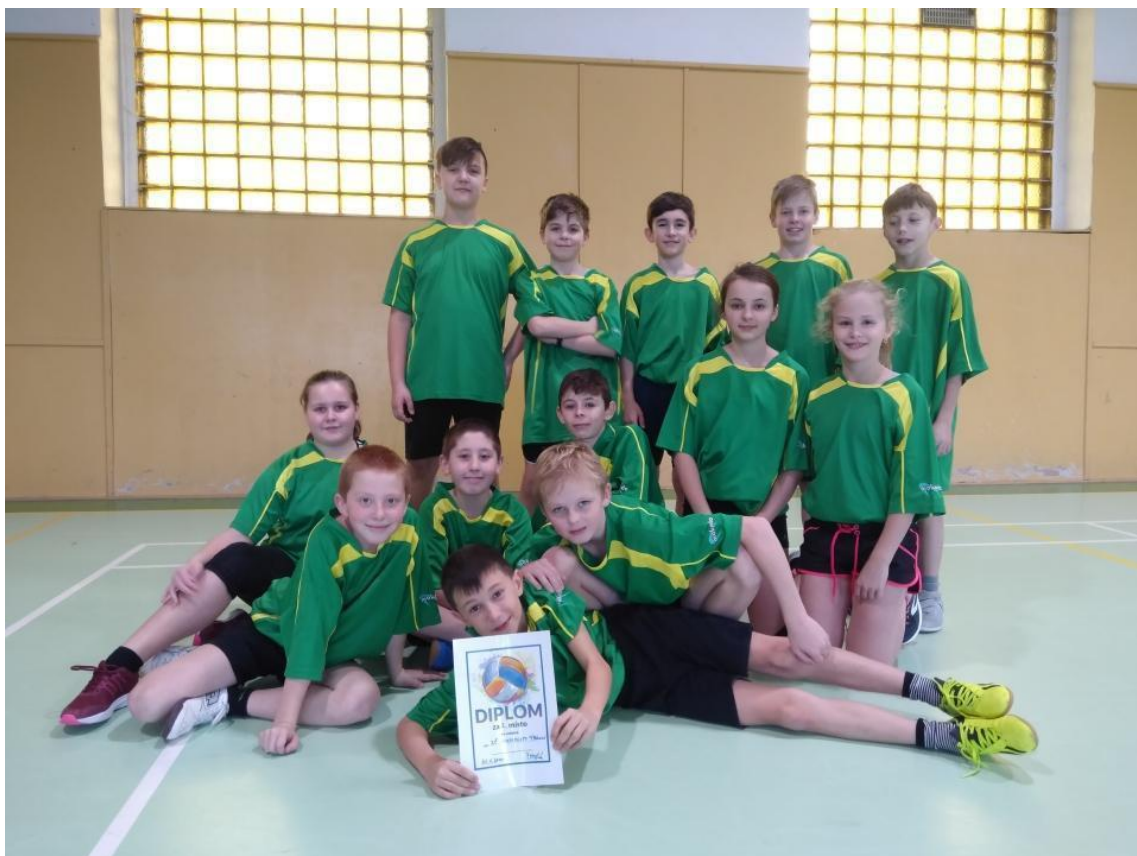
Vybíjená 4.-5.r. Milovice - leden 2020