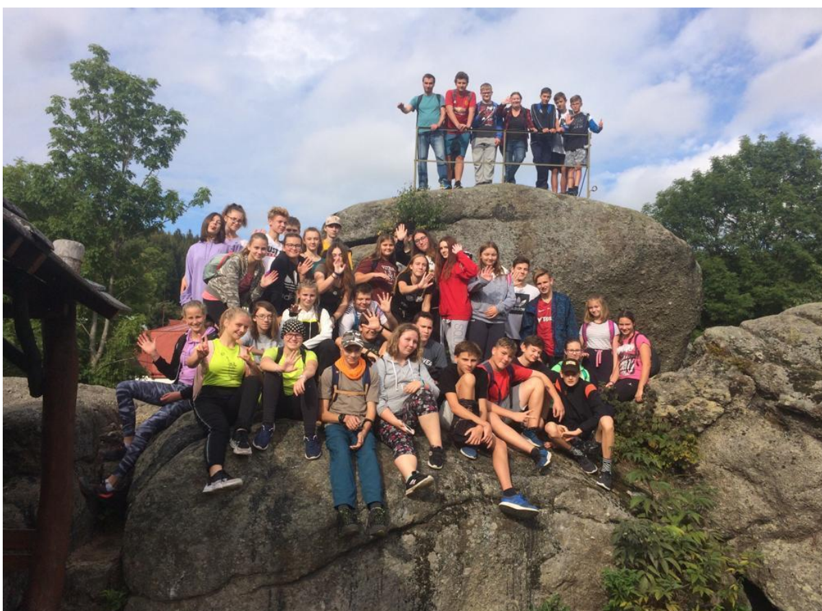
Kurz OSV 8.-9.r. - září 2019