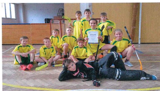
Viechna foto: Archiv ZŠ