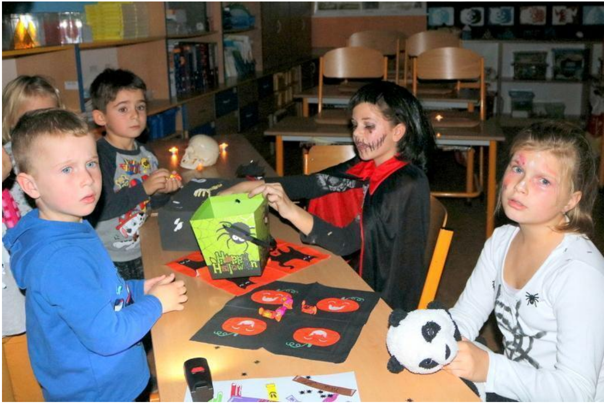
Tajemná noc ve škole - listopad 2019