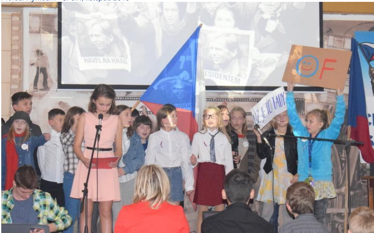
Cesta ke svobodě - listopad 2019