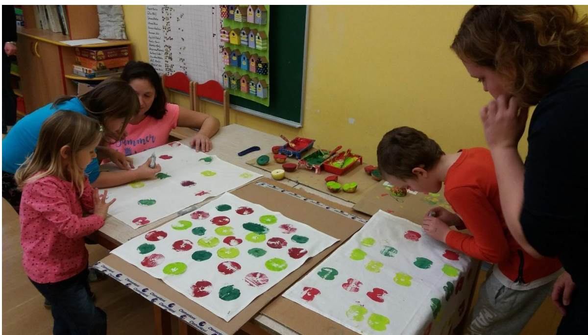
Vánoční tvoření v ŠD - prosinec 2019