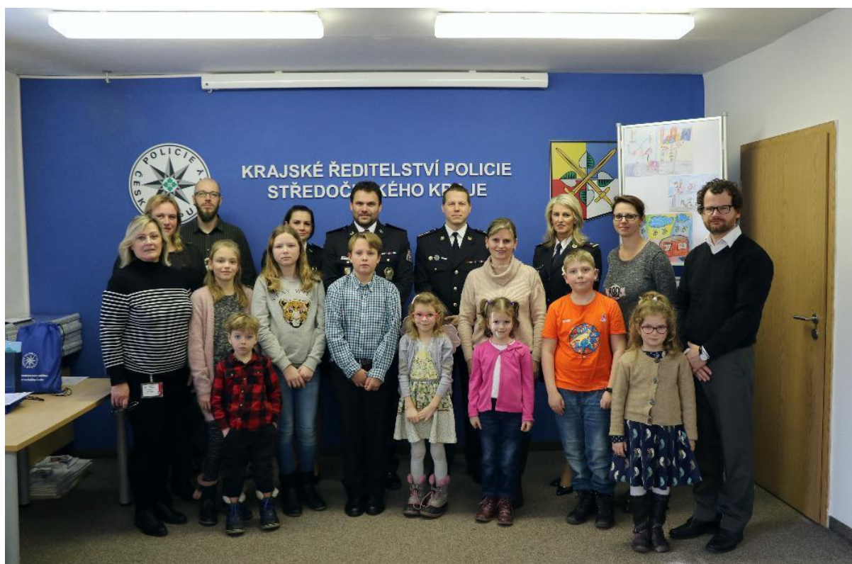
Výt. soutěž Policie ČR - vyhlášení výsledků – leden 2020