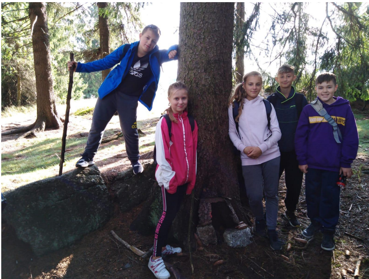
Kurz OSV 6.-7.r. - září 2019