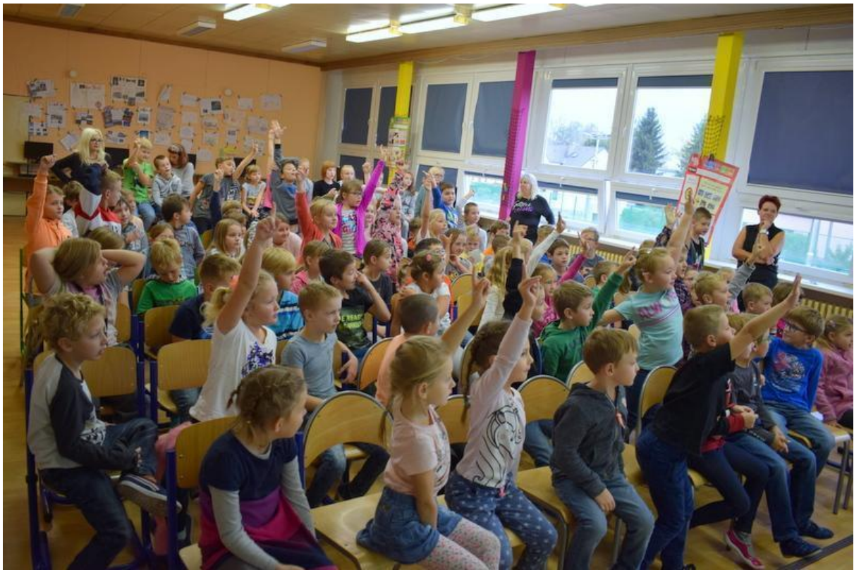
Evropský den jazyků - říjen 2019