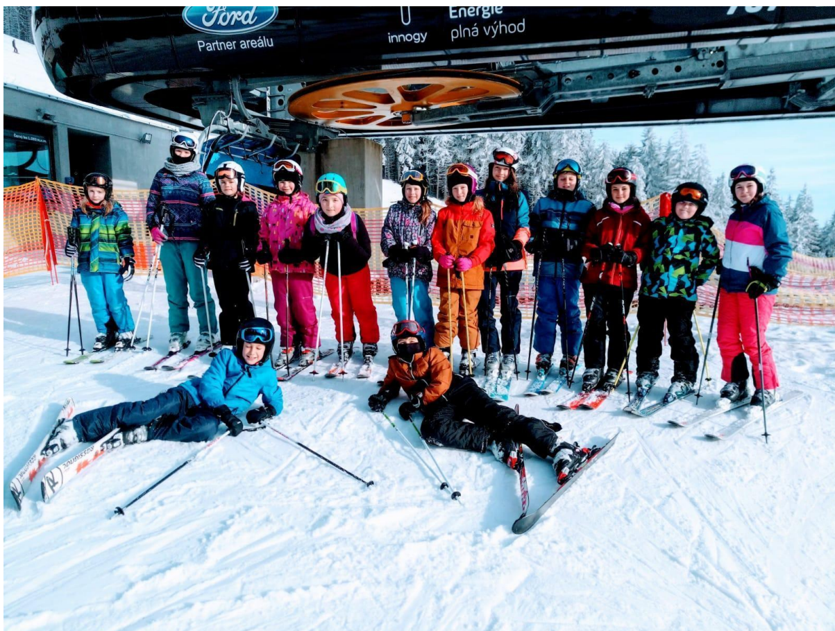
Lyž. kurs - leden 2020