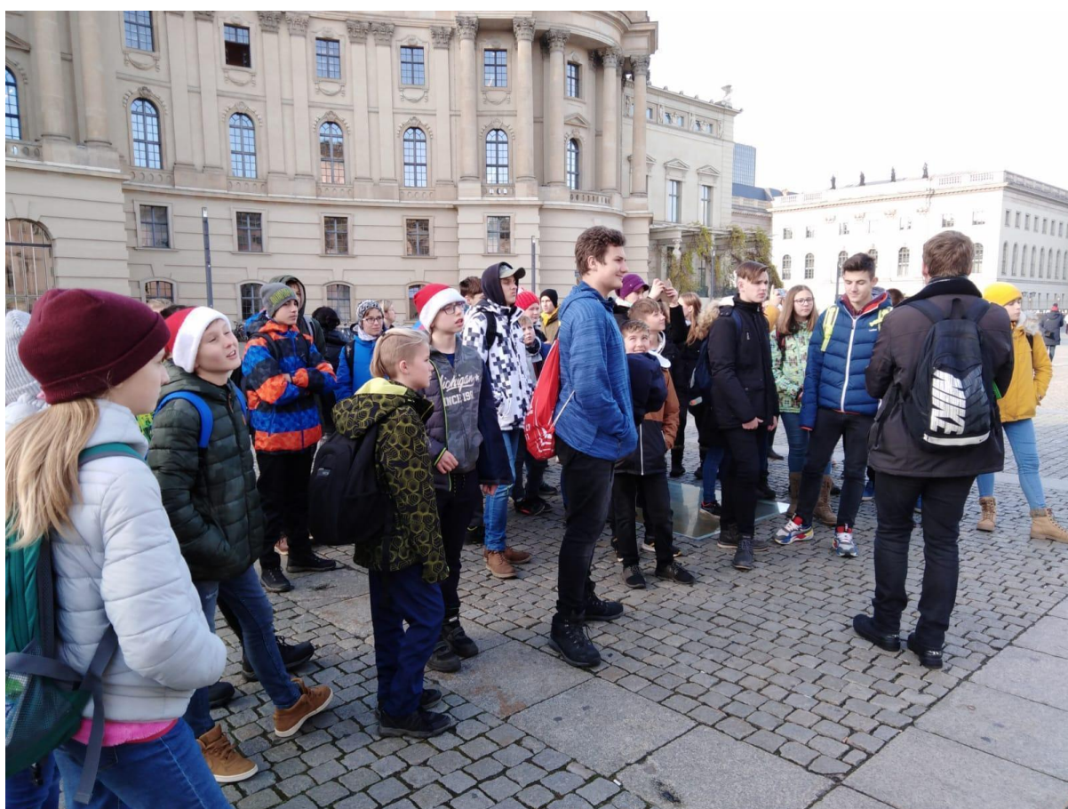
Berlín - prosinec 2019 1