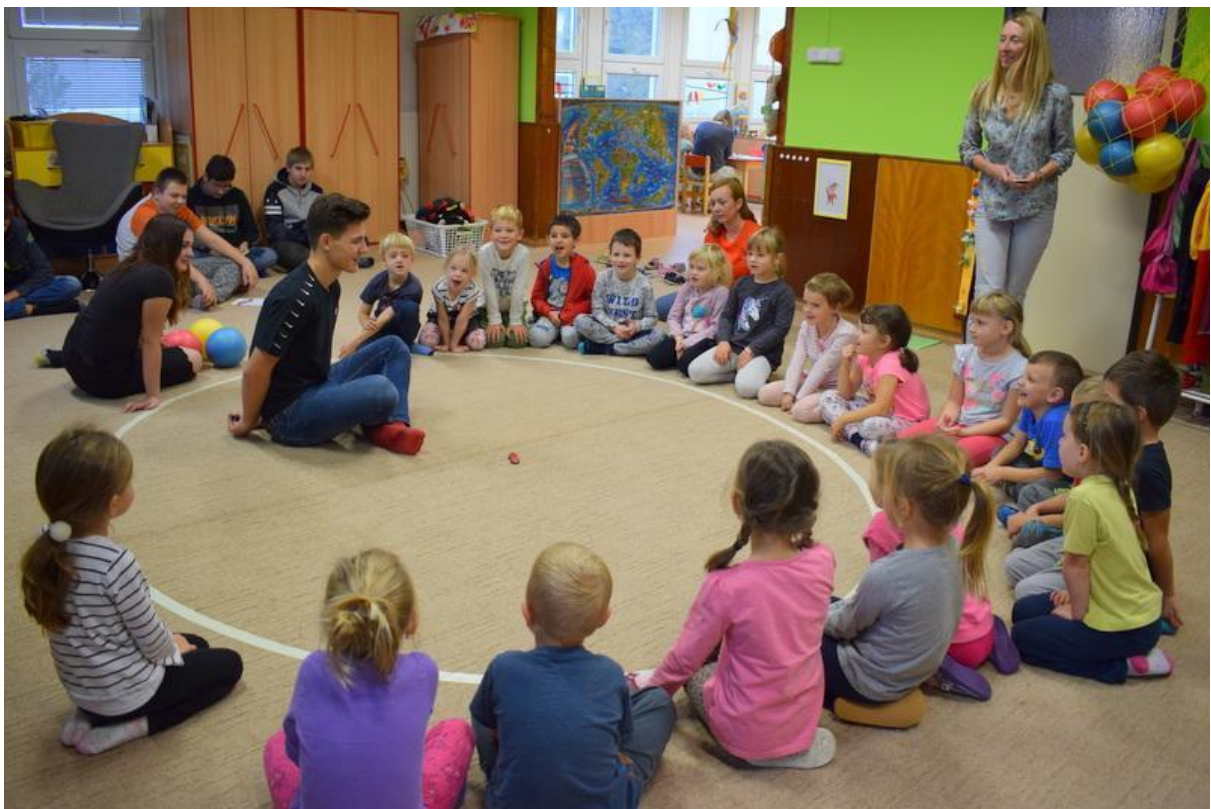
Učíme se učit - říjen 2019