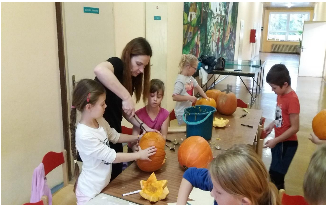
Dlabání dýní - listopad 2019