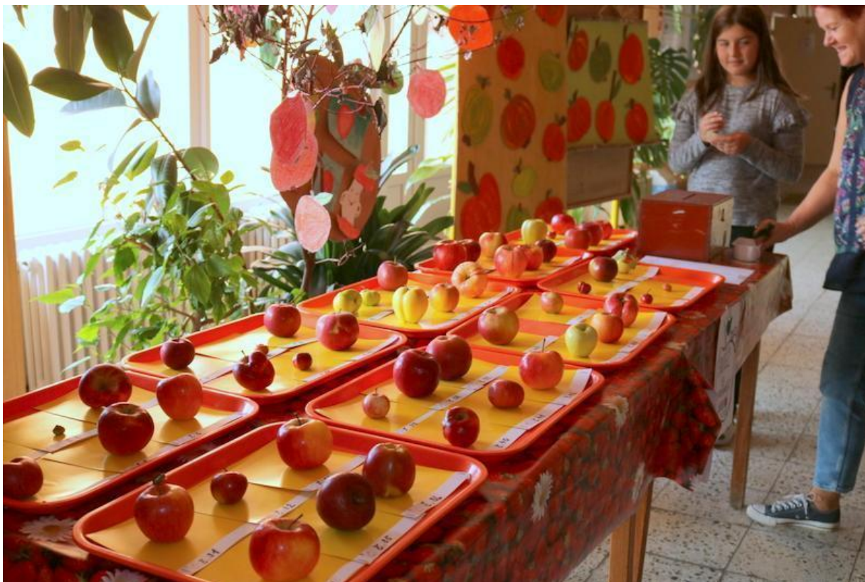
Soutěž o nejkrásnější jablíčko-říjen 2019